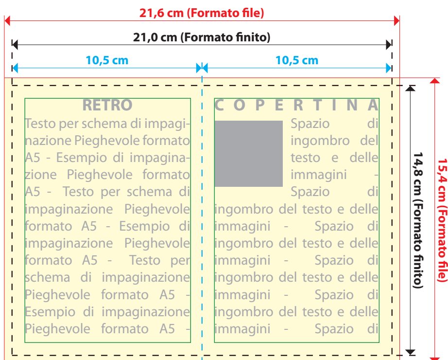
Vista dell' ESTERNO dello stampato aperto